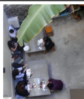
Zimmer, Frühstück, Pläne schmieden - das reicht im 29 Madeira Hostel.

Das ist keine Gefahr für die Tourismusbranche, sondern eine Chance. Beliebiger steigern kann man die Zahl der Touristinnen und Touristen sowieso nicht, so viel Platz ist gar nicht auf der Insel, es sei denn, man baut Hotels noch höher, aber dann sieht man die Sonne irgendwann vor lauter Schatten nicht mehr. Höher könnten allerdings die Löhne für die Frauen und Männer sein, die sich in der Tourismusbranche für 650 Euro im Monat abrackern und nicht einmal einen Arbeitsvertrag haben.